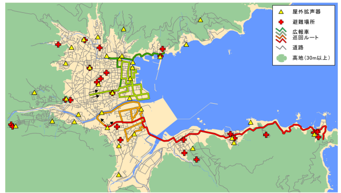
図 2 分析対象地域

図 2 に対象地域の全景と各種施設の配置状況を示す。基本条件として、住宅地図に記された人家から 6,651 世帯の分布を入力した。また、情報伝達施設として 35 基ある既設の防災行政無線の屋外拡声器と災害時に巡回する 4 台の広報車の移動ルートを入力した。この他、尾鷲市が津波に対応した避難場所としている 25 箇所の施設を避難場所として設定した。今回の計算では、標高 30m 以上の土地についても避難場所として設定し、この高さ以上の居住する住民に