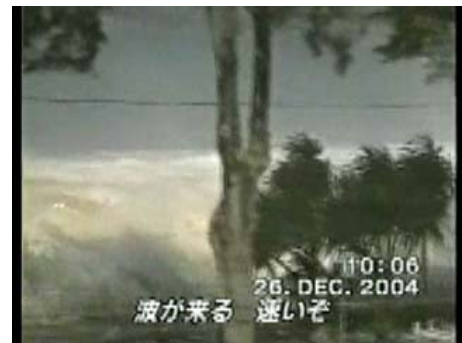
【動画-01】[2:10] 2004年インド洋津波(海岸到達の様子)