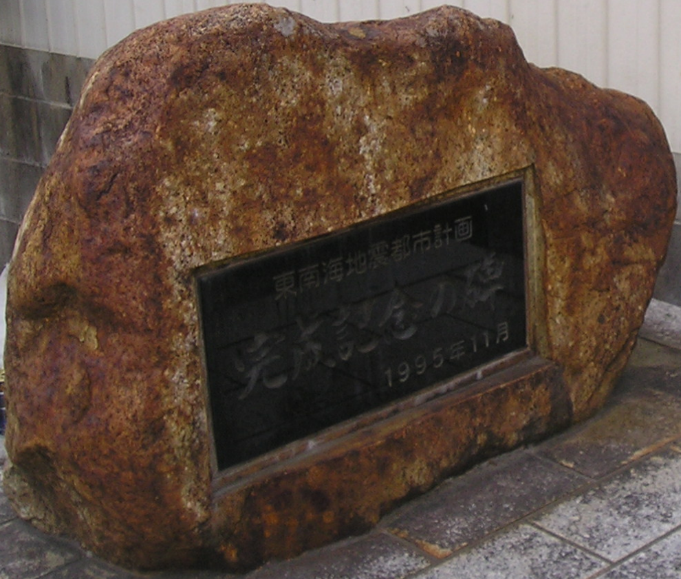
賀田2-② ( 東南海地震都市計画完成記念碑、20060309 )