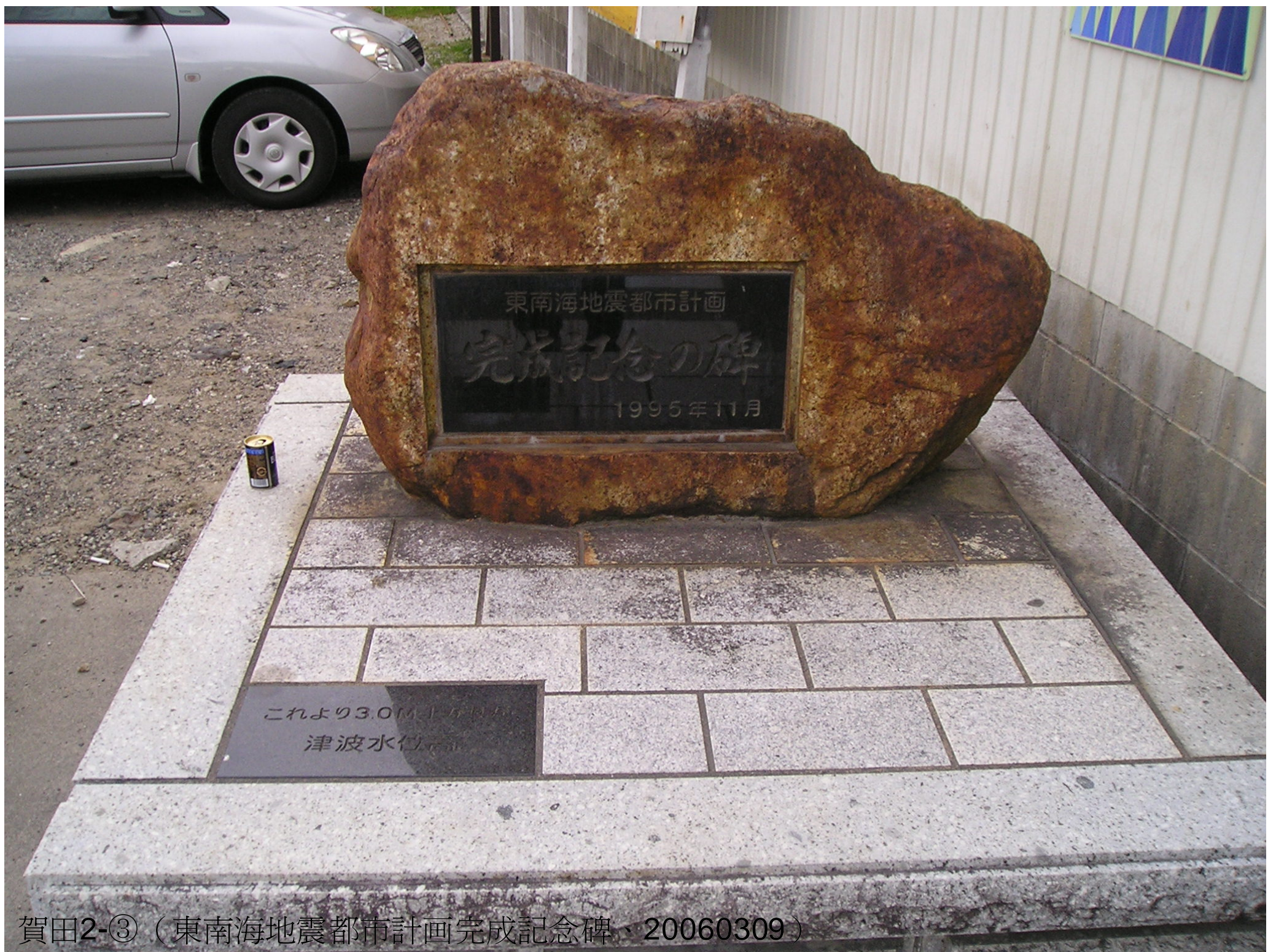
賀田2-③ (東南海地震都市計画完成記念碑、20060309)