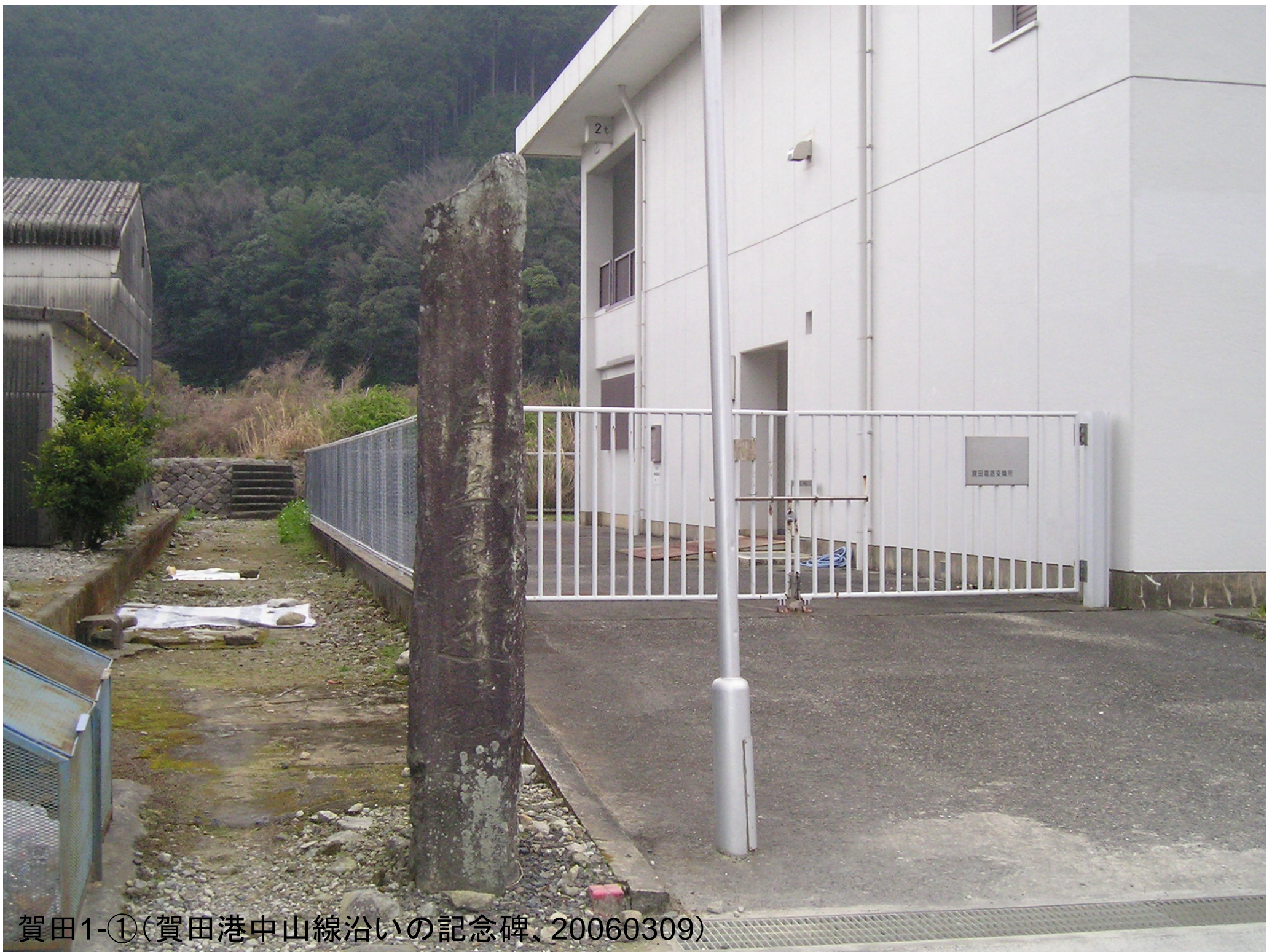
賀田1-①(賀田港中山線沿いの記念碑、20060309)