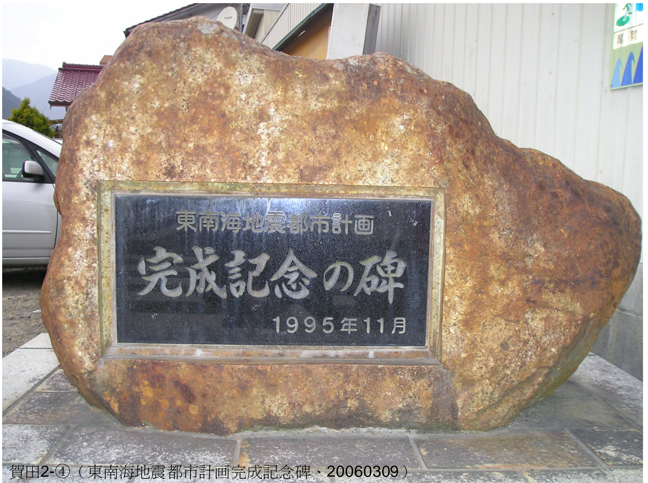
賀田2-④ (東南海地震都市計画完成記念碑、20060309)