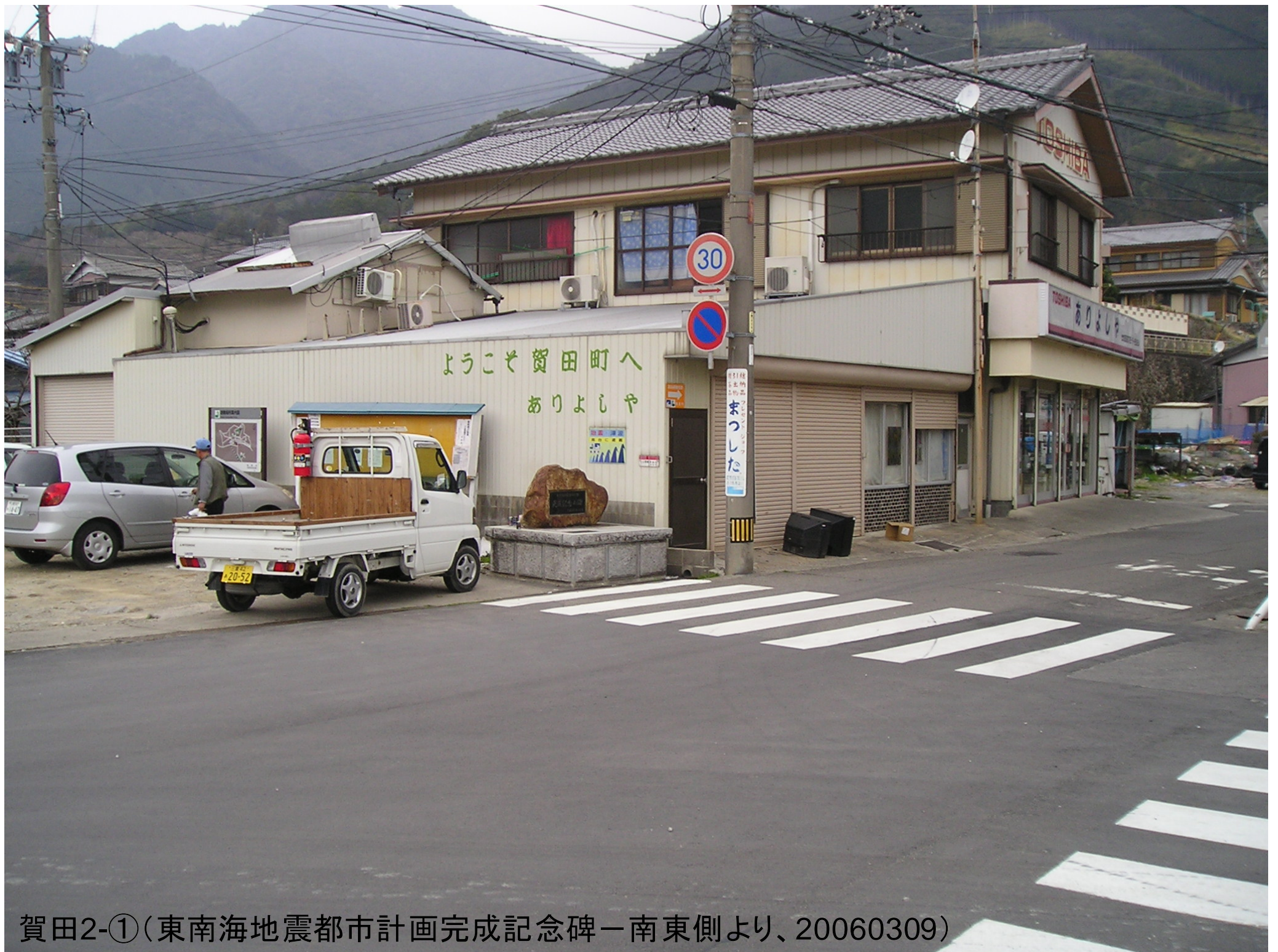
賀田2-①(東南海地震都市計画完成記念碑一南東側より、20060309)