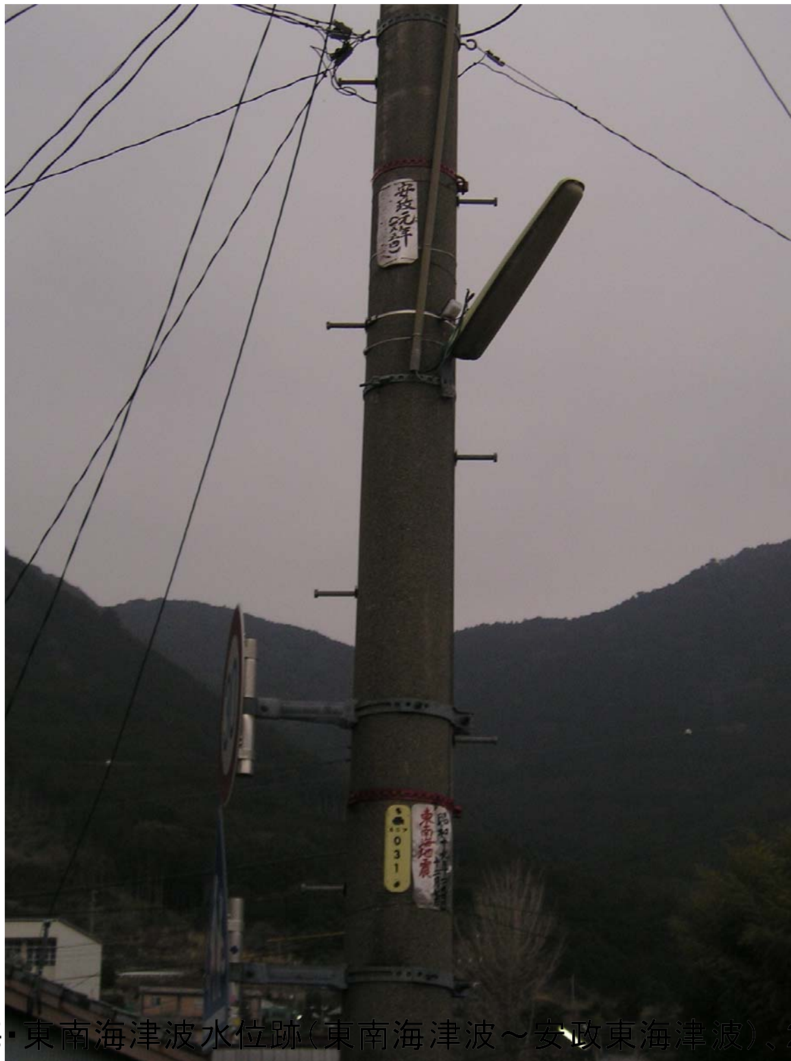
賀田3-④(安政東海・東南海津波水位跡(東南海津波～安政東海津波)、20060309)