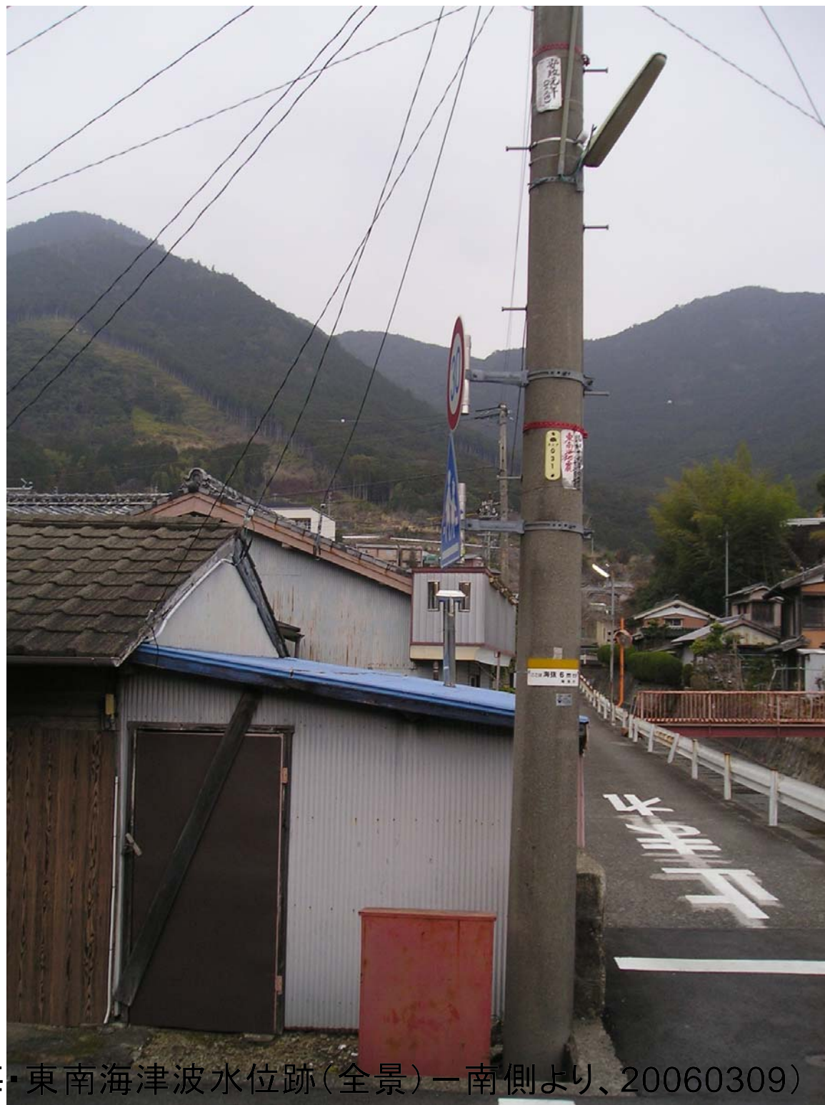
賀田3-②(安政東海・東南海津波水位跡(全景)一南側より、20060309)