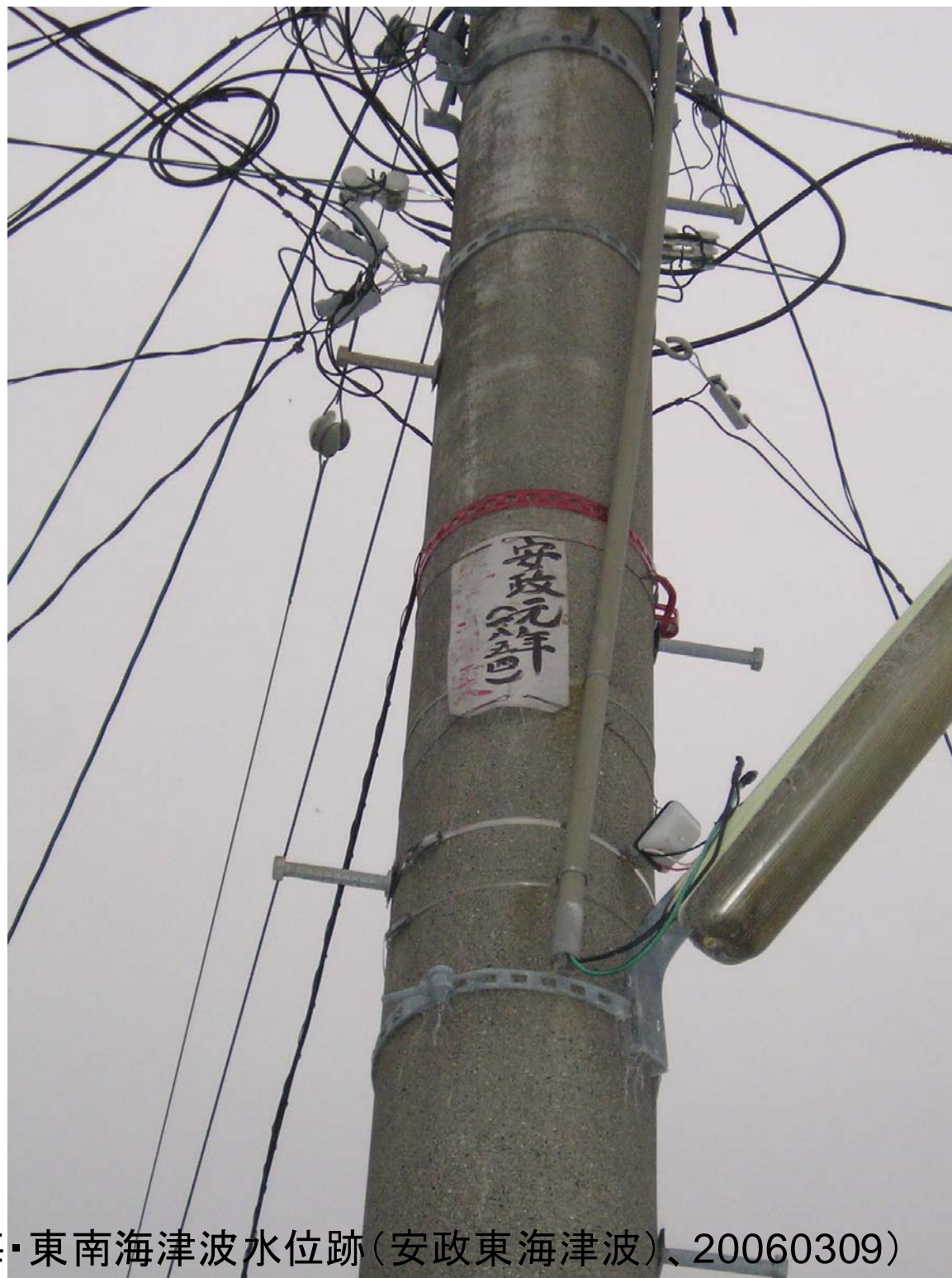
賀田3-⑥(安政東海・東南海津波水位跡(安政東海津波)、20060309)