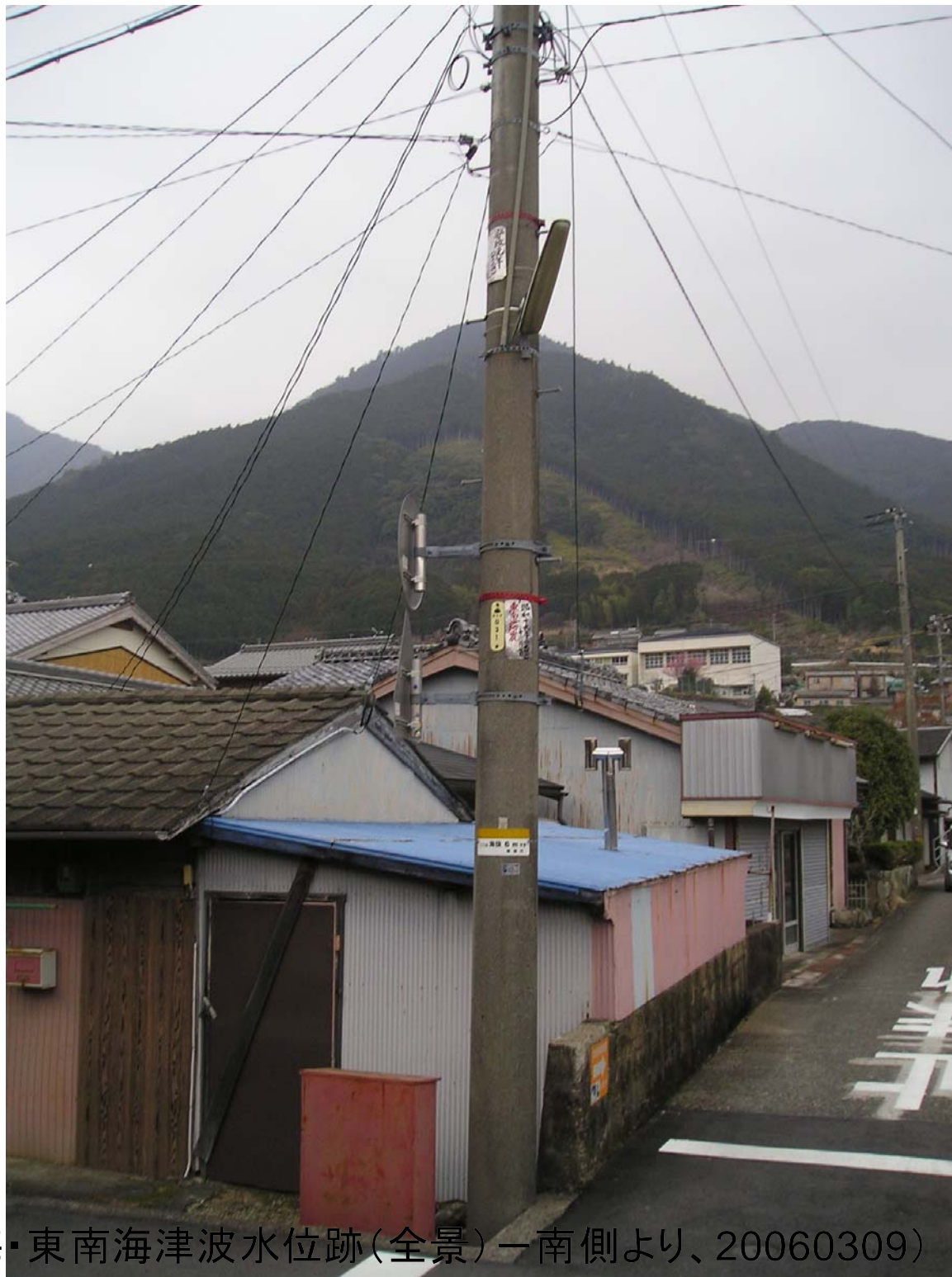
賀田3-⑦(安政東海・東南海津波水位跡(全景)一南側より、20060309)