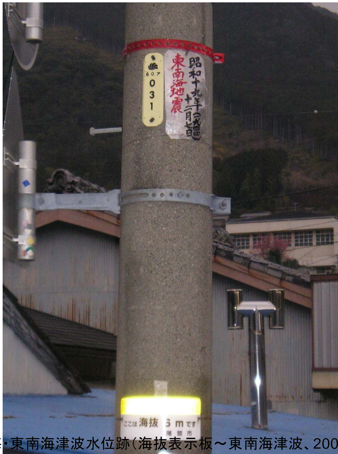
賀田3-③(安政東海・東南海津波水位跡(海拔表示板～東南海津波、20060309))