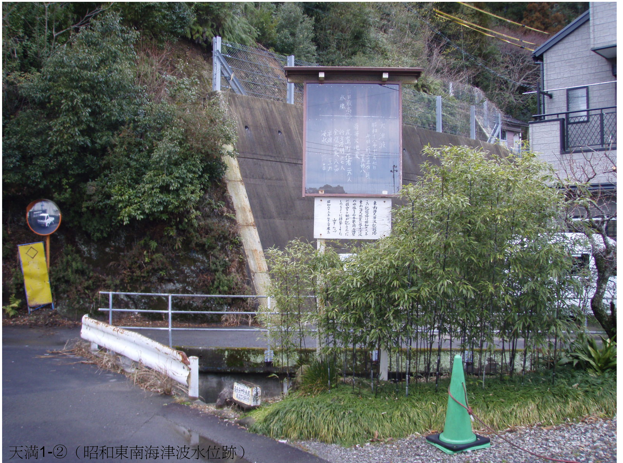
天満1-②（昭和東南海津波水位跡）