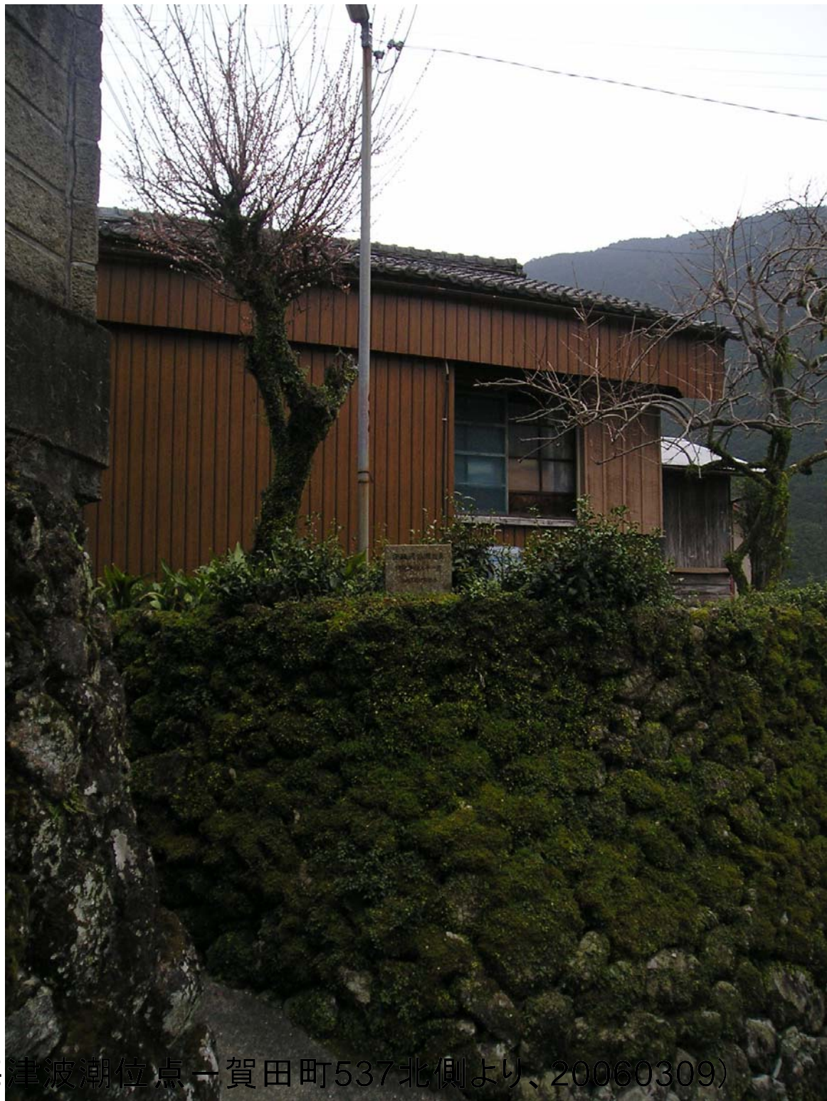
賀田4-①(安政東海畫波潮位点—賀田町537北側より、20060309)