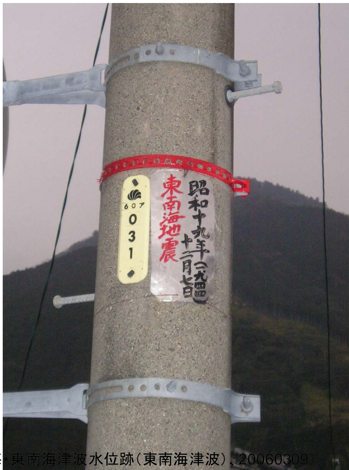
賀田3-⑤(安政東海・東南海津波水位跡(東南海津波)、20060309)