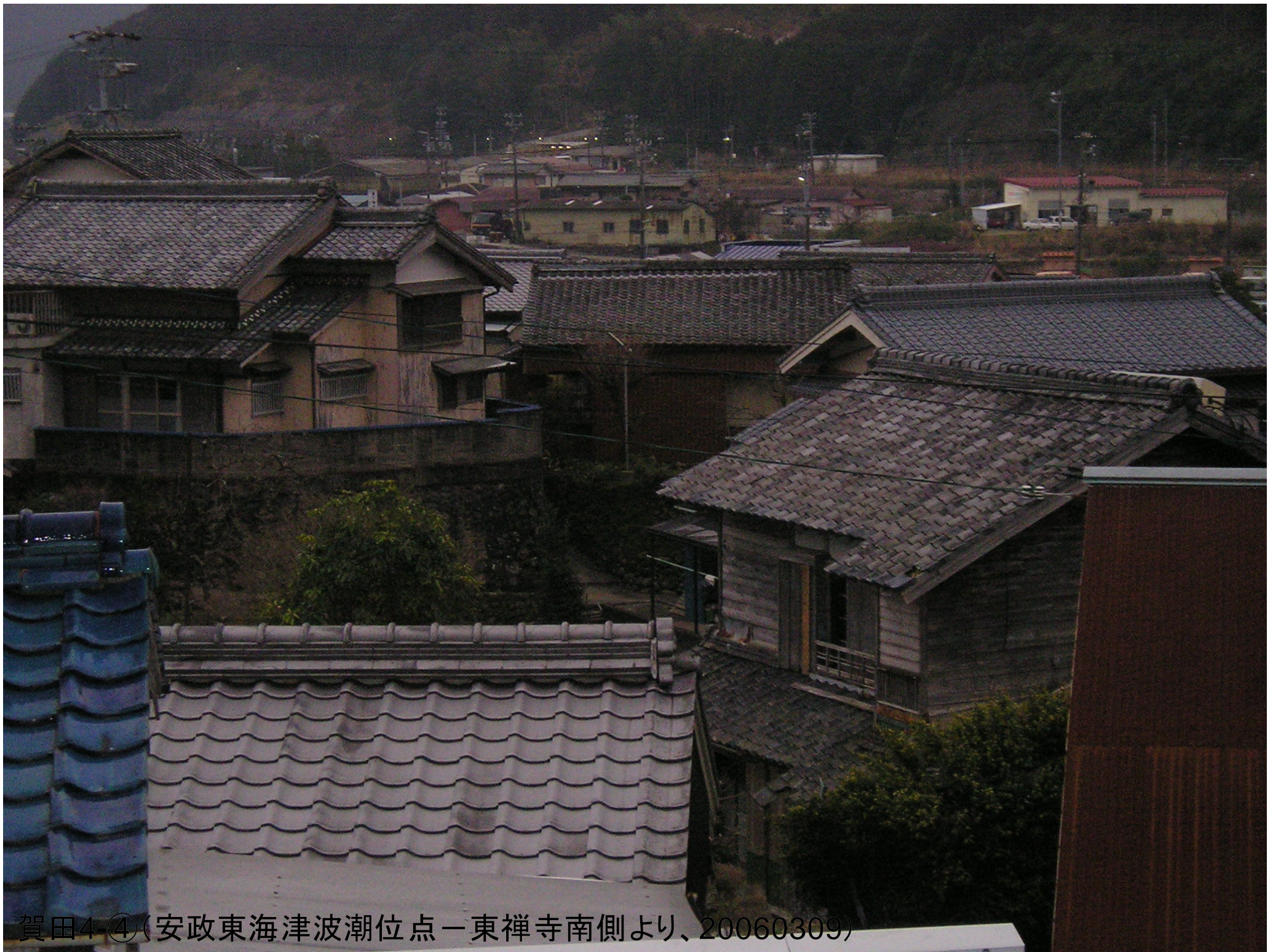
賀田4 ④(安政東海津波潮位点一東禅寺南側より、20060309)