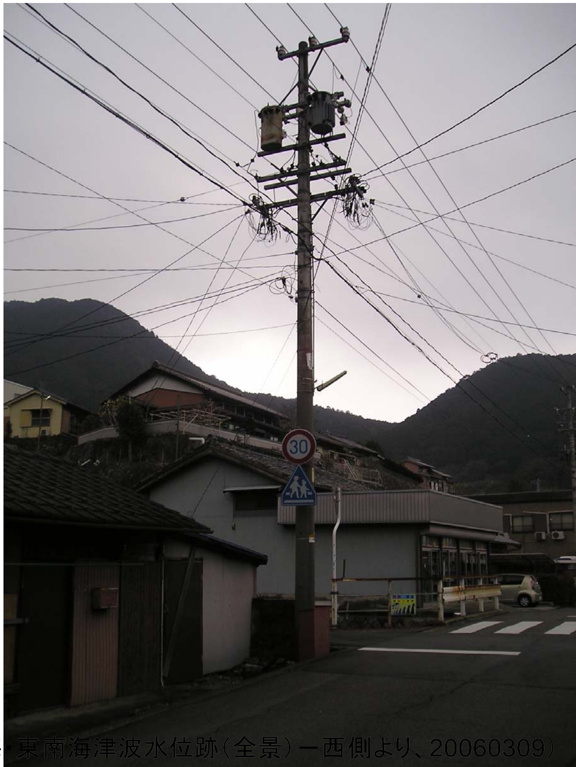
賀田3-①(安政東海 東南海津波水位跡(全景)一西側より、20060309)