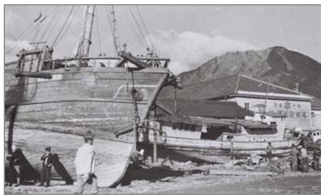
【写真-01】 [17枚] 1944年 昭和東南海地震津波による尾鷲市の被害